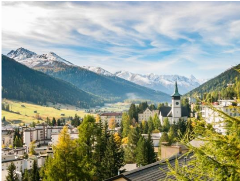
Davos ist als Urlaubsort im Sommer und im Winter beliebt.