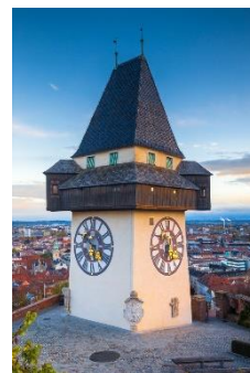
D Grazer Uhrturm