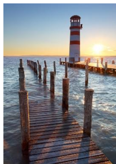
B Neusiedler See

___ 1 Diese Attraktion gibt es seit 1897. Es ist das Wahrzeichen von Wien. Bekannte Filme wie z. B. „Der dritte Mann“ mit Orson Wells und der James-Bond-Film „Der Hauch des Todes“ spielen hier. Auf einer Höhe von 65 m hat man einen tollen Blick auf die Hauptstadt.