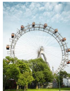
C Wiener Riesenrad

___ 4 Hier scheint über 300 Tage im Jahr die Sonne und die Menschen machen gerne hier Urlaub. Bis nach Wien fährt man nur eine Stunde mit dem Auto. Man kann hier surfen, segeln und mit dem Fahrrad über 1.000 km um den See fahren.