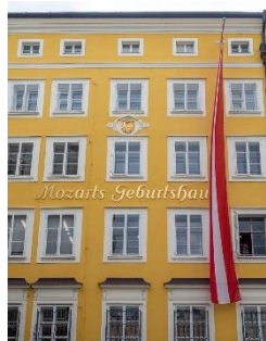
A Mozarts Geburtshaus