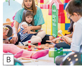
B der Kindergarten