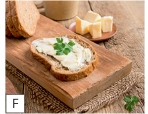
F das Butterbrot