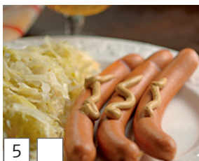
5 wurstel (Italienisch)