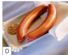
D das Würstchen / das Würstel