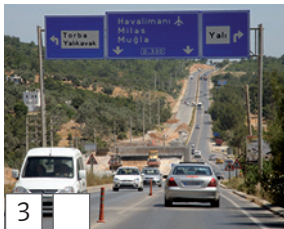
3 otoban (Türkisch)