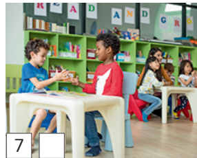
7 kindergarten (Englisch)