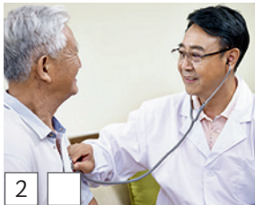
2 クランケ (~ kuranke) (Japanisch)