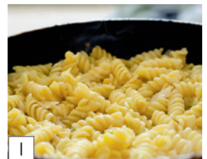
I die Nudeln