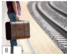
8 куфар (~ kufar) (Bulgarisch)