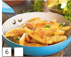
6 nudli (Ungarisch)