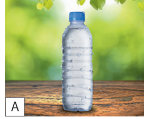
A die Flasche