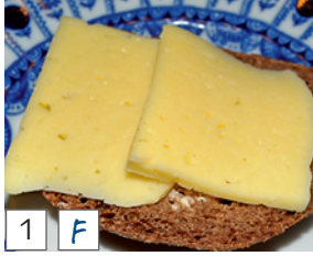
1 F бутерброд (~ buterbrod) (Russisch)

2 Wie heißen die Wörter in Ihrer Sprache? Notieren Sie unter den deutschen Wörtern.