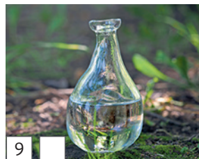
9 flaša (Serbisch)