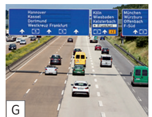
G die Autobahn