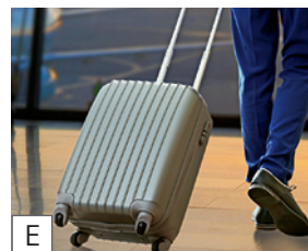
E der Koffer

5D, 6I, 7B, 8E, 9A Lösung für 1: 2C, 3G, 4H,